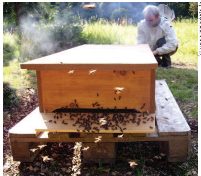
Een Bienenkiste in gebruik

De moderne imker is een natuurliefhebber, die vooral geniet van het kijken naar bijen in plaats van het bezig zijn met het bijenvolk. Hij wil ook nog wel een potje honing voor zichzelf oogsten, maar zeker geen honing winnen als een soort bijverdienste. Voor dit type imker is de bijenkist, die Bienenkiste bedacht. Deze kast is een moderne voortzetting van de Bauernstock. De kast heeft geen raampjes maar de bijen bouwen de raat in lengterichting tegen het dak, koude bouw dus. Om dat te bereiken