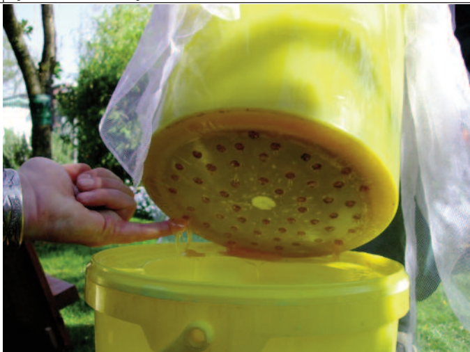
De raat met honing laat men in een zeef uitlekken

geveer de zwerm af kan komen. Na de oogst van de zomerhoning kan de vrij gekomen ruimte benut worden voor het toedienen van varroabestrijdingsmiddelen. Door de eenvoudige constructie kan men de kast met betrekkelijk weinig middelen maken. Meer bijzonderheden vindt u op www.bienenkiste.de .